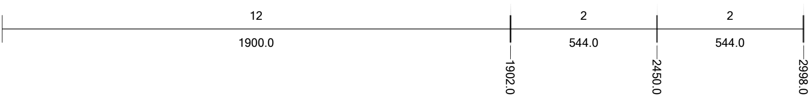
2/10 -- 0-bar/011, 60.0 × 22.0 -- 3000.0 mm -- Exempleaire unique