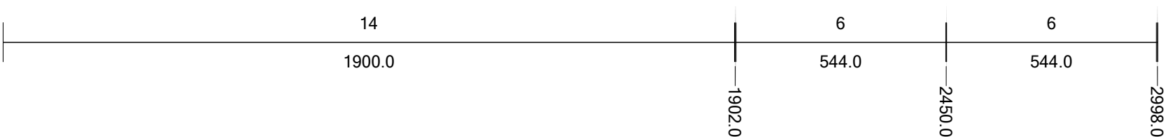
4/10 -- 0-bar/011, 60.0 × 22.0 -- 3000.0 mm -- Exempleaire unique