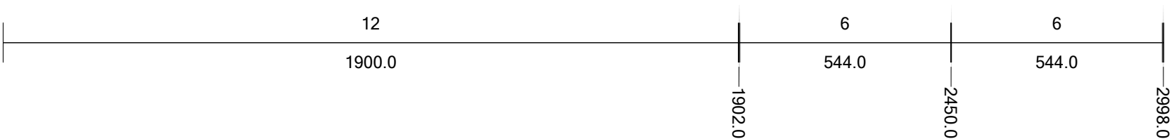
3/10 -- 0-bar/011, 60.0 × 22.0 -- 3000.0 mm -- Exempleaire unique